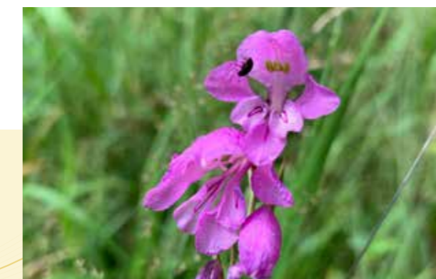
Rarissimo gladiolo protetto (Gladiolo Piemontese)

Chi lavora presso la nostra struttura, opera in un ambiente aperto e positivo e si sente accolto e accompagnato nelle diverse esperienze e nei diversi percorsi. La FARM offre possibilità concrete di formazione, sviluppo, crescita professionale e personale , tese a migliorare le rispettive competenze.